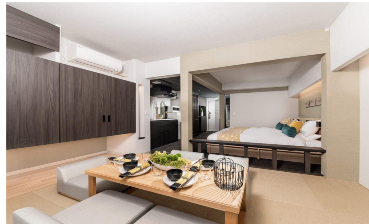
【ファミリースタンダードルーム(和洋室)】