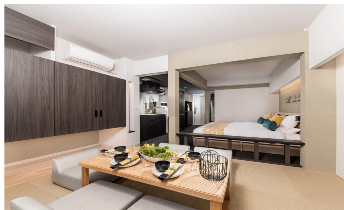
【ファミリースタンダードルーム(和洋室)】