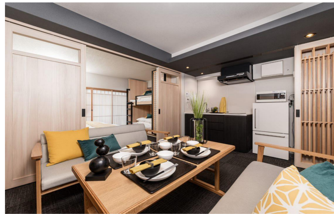
【ファミリースタンダードルーム (2段ベッド/ソファベッド)】