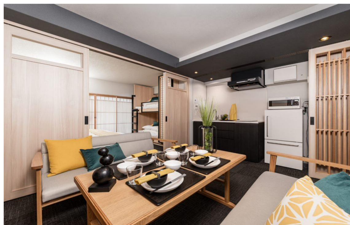
【ファミリースタンダードルーム(2段ベッド・ソファベッド)】